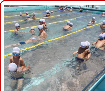
《1,6年合同体育(水泳)の一場面》

明日から子ども達が楽しみにしている夏休みに入ります。この夏休みが楽しいものになるよう、安全、健康に気をつけて、規則正しい生活を心がけてほしいと思います。8月24日までの34日間、子ども達は地域で過ごします。どうぞあたたかく見守っていただきますようよろしくお願いいたします。