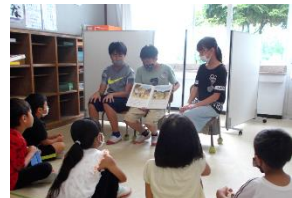
《7/9 図書委員会読み聞かせ》

1,2年生のために、ゆっくりと丁寧に絵本を音読した図書委員たち。2学期も再びこのような機会があればと感じる素敵な取り組みでした。