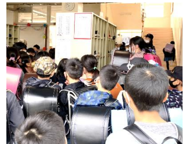
〈さあ、どっちのクラスかな?〉

児童玄関前のプランターにたくさんの菜の花が咲きました。その鮮やかな黄色が登校してきた子ども達を迎え、8日、新学期がスタートしました。それぞれが新しい学年になった子ども達。本年度から全学年がクラス替えです。児童玄関に掲示されたクラス名簿に自分の名前を探すドキドキの瞬間。いろんな声が聞こえてきました。自分の名前を見つけたあとは新しい下足ロッカーを探し、無事に下足を入れて教室へ。初日の朝ならではのこの光景は、見ていた私も心地よい緊張感を感じました。新しいクラスでみんなが元気に頑張れますように。心の中で願う私でした。