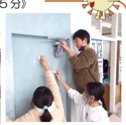
防火扉もすみずみまで