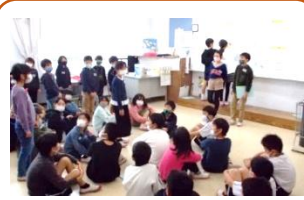
ベアクラスで「学校パワーミーティング」(写真は5A+3B)