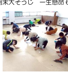
みんなで教室床磨き