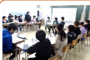
3学期の児童会の目標を話し合った「代表委員会」