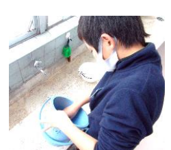
給食用具を念入りに