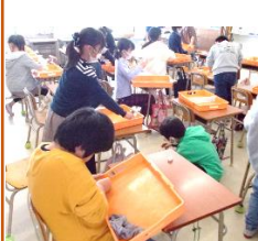
引き出しをピカピカに