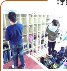
下足箱をほうきと雑巾で