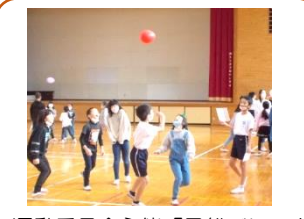
運動委員会主催「風船バレーボール大会」1位は507回!