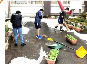
冬の朝でも続く 環境委員による玄関前掃除