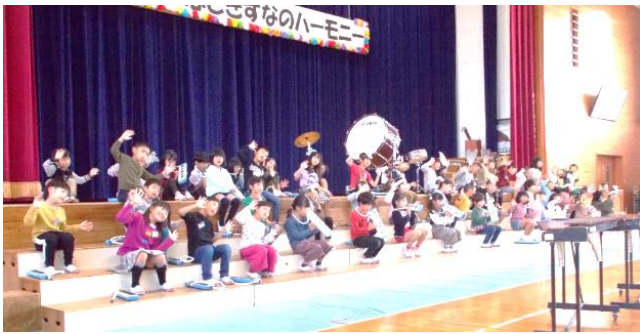
1年 音楽劇「おむすびころりん」

社小の子ども達の素敵な姿を存分に見ることができ、本当にうれしい1日となりました。