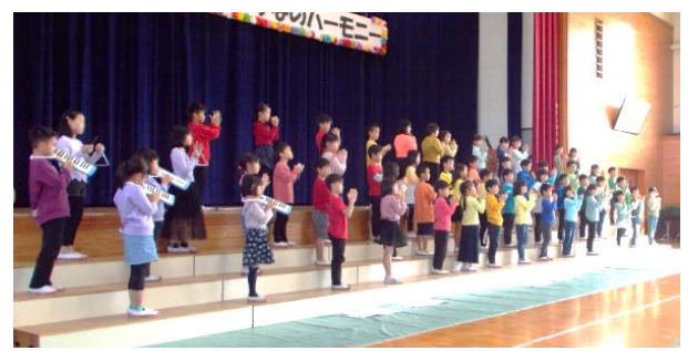
2年 合奏「スペインのカスタネット」斉唱「メッセージ」

まさに圧巻の演奏。全員が一体となって、思いの込もった音を、しっかりと観客に届けました。手拍子で会場を包み込む場面もありました。聴いている私達も楽しく元気な気持ちになりました。