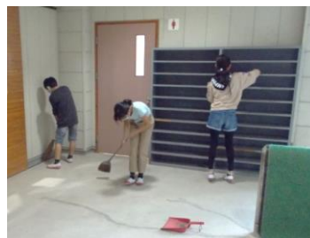
体育館入り口も念入りに