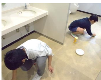
トイレの床をていねいに