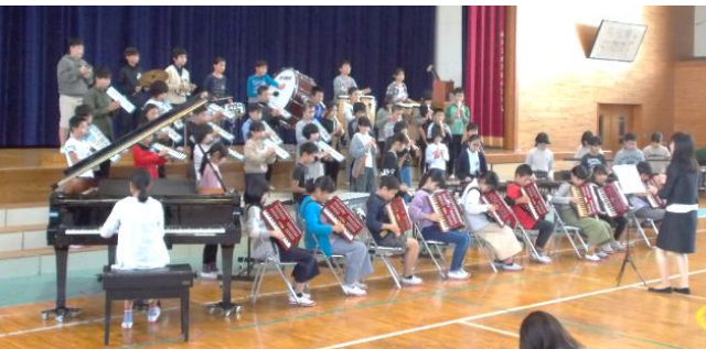
5年 合奏「情熱大陸 メインテーマ」

持ち前のパワー全開。話す言葉もよく聞こえ、リコーダーの音も歌声もきれいでした。動きにまとまりがあり、英語や手話も取り入れるなど、よく工夫された素敵なステージでした。