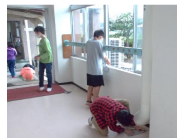
すみずみの汚れを見逃さず