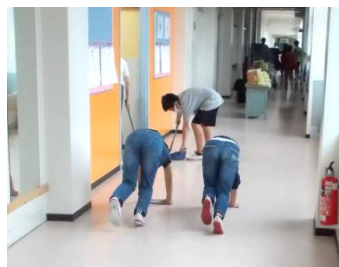
何往復もそうきんがけ