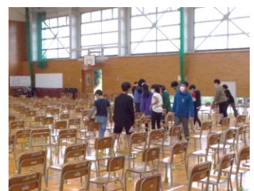
いすの並びを美しく