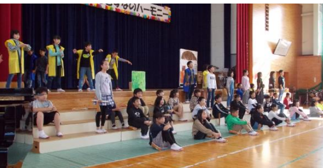
4年 音楽劇「ごんぎつね」

カスタネットの音が会場に響きわたりました。難しいリズムをよく頑張って演奏しました。2年生から社小のみんなへ、そして世界のみんなへ。曲にのせたメッセージも素敵でした。