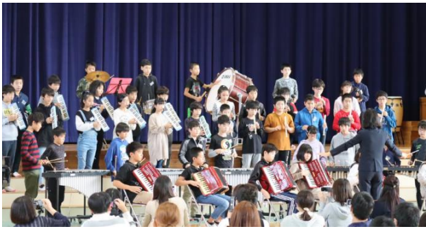
6年 合奏「紅蓮華（ぐれんげ）」

声の大きさ、台詞を言うときの動きの工夫、手作りの小道具、挿入曲のきれいな歌声、リコーダーの切なく美しい音色など、見事な音楽劇でした。学んだことを伝えた最後のメッセージも心に染みしました。