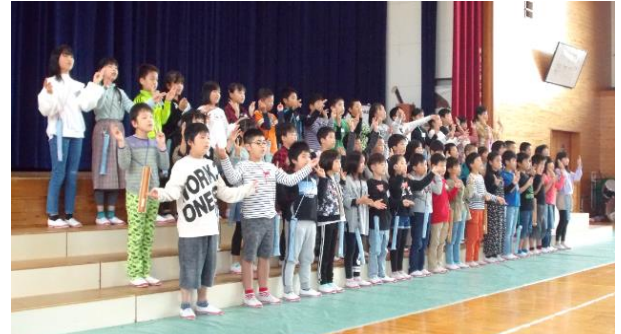
3年 合唱「友だち」リコーダー奏「ブラックホール」

元気な声が体育館に響きました。歌も演奏もよくそろっていました。かわいい表情や「すっとんとん」の動きも印象的でした。トップバッターとしての役割を立派に果たしました。