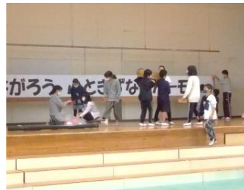
力を合わせてスローガン設置

もちろんステージ発表の頑張りは一番心を動かされますが、私は前日準備や後片付けの際の子ども達の動きを見るのも大好きで、いつも注目してしまいます。行事を創り上げるために自分はどう取り組むか、その気持ちが動きに表れます。子ども達に学ばせてもらう大切な場面だと思っています。