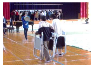
片付け作業のスピードも◎