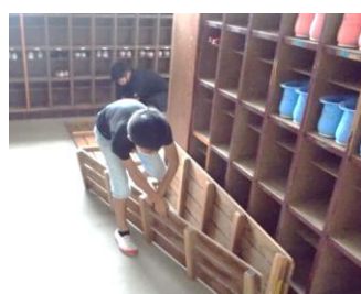
下足場のさな板を上げて