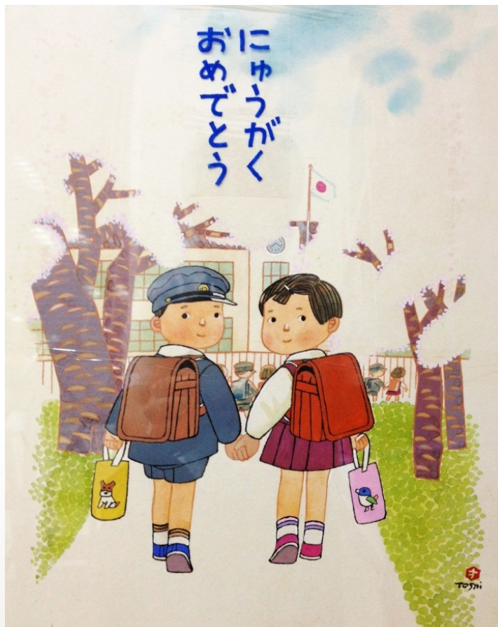
(教科書無償給与袋の原画)

令和三年度に検定を行った教科書を展示しています。 新しい教科書を手にとって御覧になりますか？御自由にお入りください。