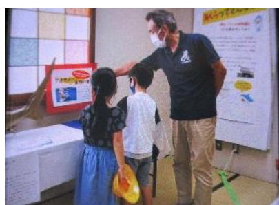
巡回サマ展を児童が見学