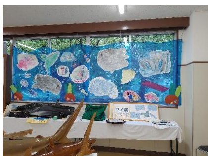
わたり保育園園児の作品