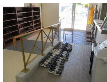
きれいに並んだ三中生の靴