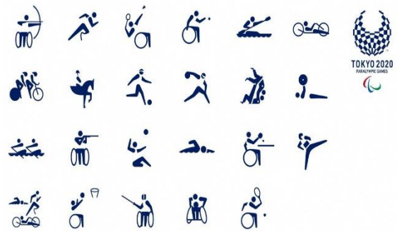
<今話題のピクトグラム。パラリンピック編です>