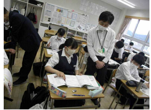
中間テスト前の質問教室の様子(2年)