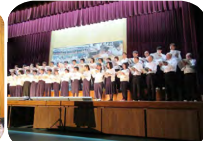
PTAコーラスは上手かったと、教育長さんからお褒めの言葉をいただきました。