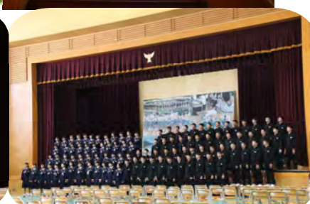
フィナーレを飾る全校合唱の3年生の様子