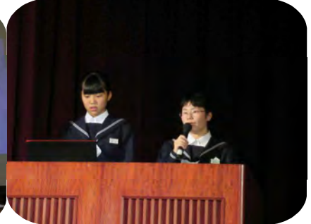
今年から始まった「総合的な学習の時間」の発表(左から1年、2年、3年)。1年は認知症サポーター養成講座に関わる内容、2年生は学年で展開する6つのプロジェクトについて、3年生は修学旅行についてそれぞれ発表しました。プレゼンの力や表現力が試されます。