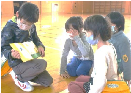
出会いのとき、2年生の読み聞かせ