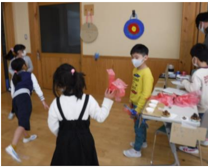
1, 2年おもちゃ祭り(生活科) 2年生を招待して手作りおもちゃで遊びました。