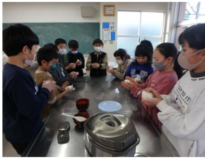
4年 お米の試食会（総合） 収穫したお米を炊いて、おにぎりにして試食しました。