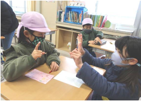
5年第2回保育所交流（総合） 日吉津保育所年長組を学校に招待して、学校体験を行いました。