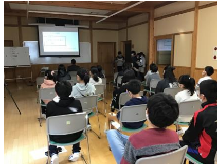
6年「村の幸福論」（国語） ipadでプレゼンを作成し、村長さんに提案しました。