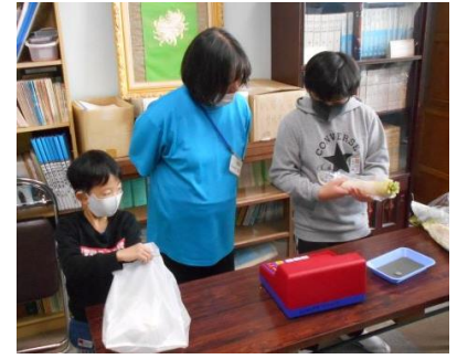
花＊はな学級（自立活動） 育てた野菜を売るお店を開きました。