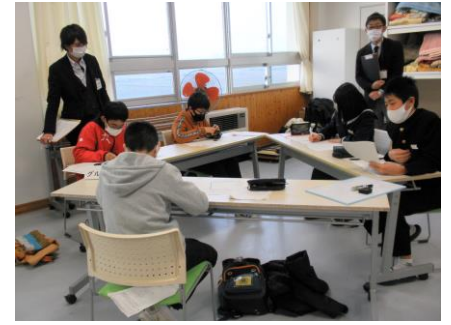
小中リーダー研修 箕蚊屋中学校で各委員会の活動を報告しました。伯仙、箕蚊屋小の代表と一緒に取り組みについて話し合いました。