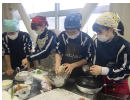
みんなで作るから、楽しい

2月13日(金)、受験シーズンまただ中の3年生が、久しぶりの調理実習でピザ作りに挑戦しました。どの班も息の合ったチームワークで、ユニークでおいしいピザが完成。勉強のことはしばし忘れて(?),みんな笑顔でピザをいただきました。