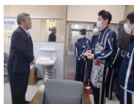
校長先生にもお届けしました