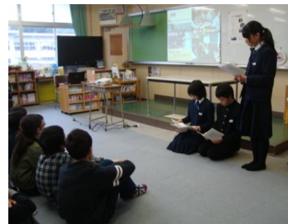
先輩らしく、わかりやすく説明