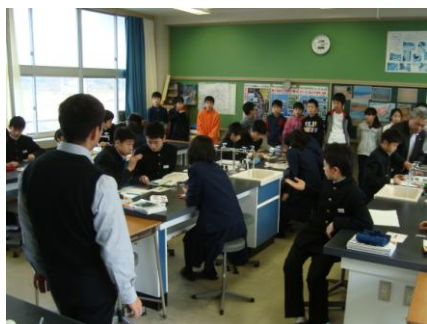
後ろが気になる(?)2年生

1月23日(金)、入学説明会を開きました。やや緊張気味の6年生たちは、6時間目の授業を見学後、校長先生や生徒会執行部の生徒たちのお話を聞きました。4月8日(水)には、ピカピカの1年生として入学です。