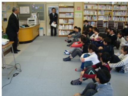
とても良い姿勢でした