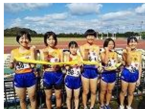
<やり切った表情の女子駅伝部>

新型コロナウイルス感染拡大防止のため、今年度は参加人数に制限があり、駅伝部全員で会場に行くことができませんでした。しかし、大会会場と学校に残っている駅伝部員をリモートで繋げ、お互い映像と声を交わし、物理的な距離はありましたが、女子駅伝部全員で一本のタスキを繋ぐことができました。やり切った女子駅伝部員はとても清々しい表情でした。