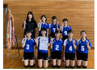
＜優勝した女子バレー部＞

10月2日(金)～4日(日)に行われた新人大会。大栄中学校の部活動の伝統のバトンを引き継ぎ新チームになった多くの生徒にとっては、はじめての公式戦でしたので、チームにも個人にも課題がたくさんあったことと思います。だからこそ、チームが、個人が、本番で「練習したことをどれだけ発揮できるのか」、そして、「今後の課題は何なのか」「何をしていかなくならないのか」を見極めるいい機会になったと思います。試合での成果や課題を踏まえ、部活動でも大栄中学校の目指す生徒像のように、お互いに響き合い、挑戦し、粘り強く取り組み、夏には一回りも二回りも成長してほしいと期待しています。さらに、各競技を通して、技能を高めること、努力の尊さを学ぶだけでなく、これから挨拶や礼儀、態度や行動やマナーについても、他校から目標にされ尊敬される大栄中学校の生徒になってほしいと願っています。