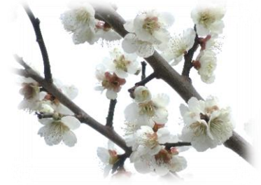
学校の隣の家の梅の花

新元号の由来と言われる梅の花。甘く清しい香りと凛とした花姿。令和最初の見ごろを迎えています。 「急な用事が入って、授業に遅れたんですけど、行ってみると生徒だけであいさつをして授業を進めていました。」とは三年社会科担当の先生。国語の時間には「誰一人置き去りにしない」ことを掲げ、「世の中」や「人生」に関わる難解なテーマにこれまでの学習を生かしながら探究的に取り組みました。理科の先生からは「もはや理科の時間は道徳です。」とも聞いています。 よくぞここまで、と思いつつながらあなたたちとともに学ぶ幸せを感じます。間違いありません。あなたたちは、令和史上かつてない最高の三年生です。……ここに令和の花の香りも高く、あとの願いはただ一つ。サクラサク。(K)