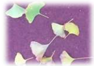
散った校庭のイチョウの葉

校庭の東側にイチョウの木が並んでいます。金色の小鳥、と見まごうばかりに色づくのはいつの日かと見守っていたのですが、どうやら緑色を残したまま散ってしまうようです。新聞に台風19号による塩害で葉が色づかないという記事を見ましたが、本校のイチョウもそうなのでしょうか。環境により木の葉もいろいろです。校内では、今日も生徒の未熟な言葉遣いを、先生方が言い直して聞かせています。私たちがこそが生徒のための一番の環境たらんと根気強く、丁寧に、丁寧に。ある日、ふと寄った多目的室の黒板にメッセージを見つけました。掃除当番に向けてでしょうか。「いつもきれいにしてくれてありがとう。K先生」。それに応えるかのようにイラスト入りの「どういたしまして」のメッセージも。人の心持ちがよろずの言の葉とぞなるものです。(K)