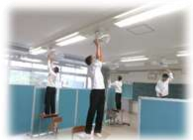
ボランティアでの扇風機掃除

暑さへと向かうこの時期、昨年の6月号も「扇風機」をお題にしました。それでいくと今年には教室に設置していただいた「エアコン」を取り上げるべきなのでしょうが、「エアコン」は季節にはならないのです。なぜだかわかりますか？その答えはエアコンは冷房だけでなく年中活躍するからです。 さて、今年はエアコンのサポート役となる扇風機ですが、それでも頑張ってもらわなければなりません。五月末にはボランティアを募り全教室の扇風機の掃除をしました。買って出てくれたのは、野球部、バドミントン部女子、柔道部、文化部の面々。総体予選前の練習時間を削って全校のためにがんばりました。私は知っています。こんなチームこそ強くなるということを。断言します。これらの部は必ず予選を勝ち抜いて県大会に出場します。文化部も県レベル以上の作品を作ります。果たして私の言うことは嘘か真か、その答えはもうすぐ出ます。(K)