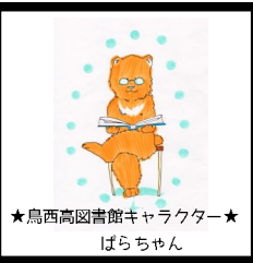
★鳥西高図書館キャラクター★ ばらちゃん