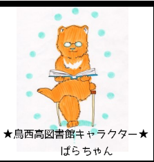
★鳥西高図書館キャラクター★ ばらちゃん