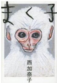
『まく子』 西加奈子/著

自分を開き、他者と交わる 中で共に変化していく ことをおそれない。有限 であるからこそ、いのち が愛おしく輝くの。成長 し続ける生徒に薦めたい 熱量の高い作品。