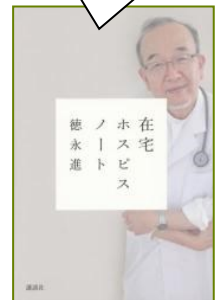
『在宅ホスピスノート』 徳永進/著

文具店とはいえ、主な仕事は代 筆屋。自分の想いを上手に伝え られない依頼主の代わりに手紙 を書いて伝える。手紙と言っ てもされど手紙。その字体、文 体で想いを伝える面白さがある。 鎌倉の小さな文具店での人間模 様が温かい。倉吉北高等学校 司書教諭