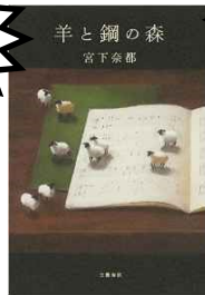
『羊と鋼の森』 宮下奈都/著