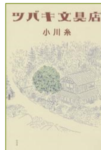
『ツバキ文具店』 小川糸/著

アドラー心理学の『嫌われる 勇氣』の続編。ほんとうの 「自立」とほんとうの「愛」 とは。どうすれば人は幸せに なれるか。思春期、様々な悩 みを抱えている高校生に読ん でほしい1冊。 パムセブ