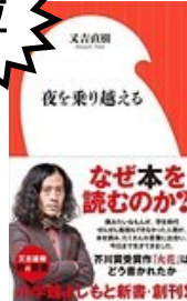
『夜を乗り越える』 又吉直樹/著