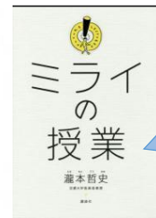
『ミライの授業』 瀧本哲史／著