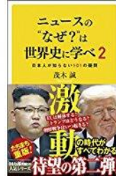
『ニュースの“なぜ?”は世界史に学べ2』 茂木誠／著