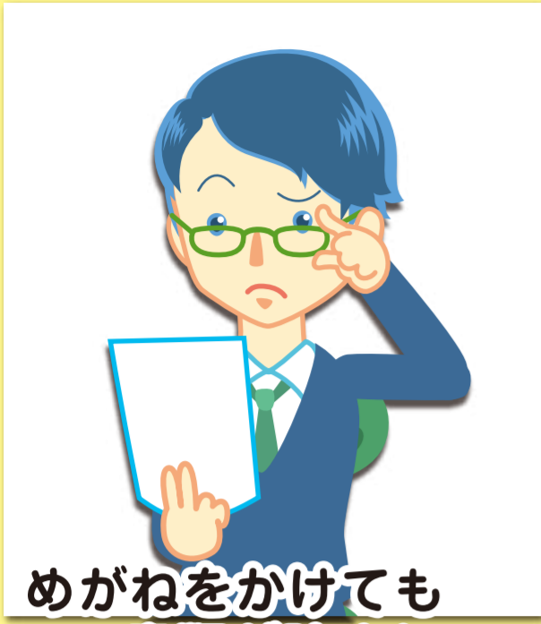
めがねをかけても 書類が読めない。