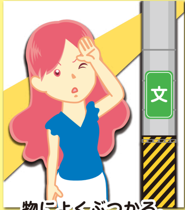
物によくぶつかる。