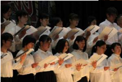
県内中学校の文化祭では最も本格的な(多分)PTAコーラス。参加していただいた保護者の皆様、お疲れ様でした。