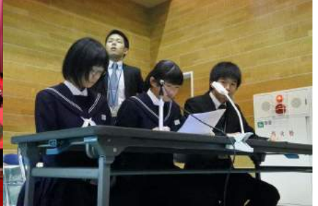
予定通りのステージ進行に向けて、総合司会や照明、大道具など、裏方も頑張ります。