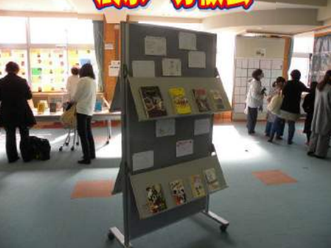
展示や分散会の会場も多くの方で賑わいました。バザーやJRCの募金にもご協力いただき、ありがとうございました。