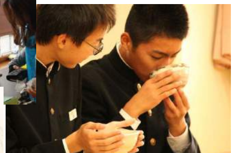
「おいしいか？」 「うーむ」