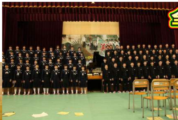
今年は『マイ バラード』と『ふるさと』の2曲を歌いました。1年主任は「全校合唱が終わった後、アリーナ天井に彼らの歌声がフワッと残っていた」と評しました。