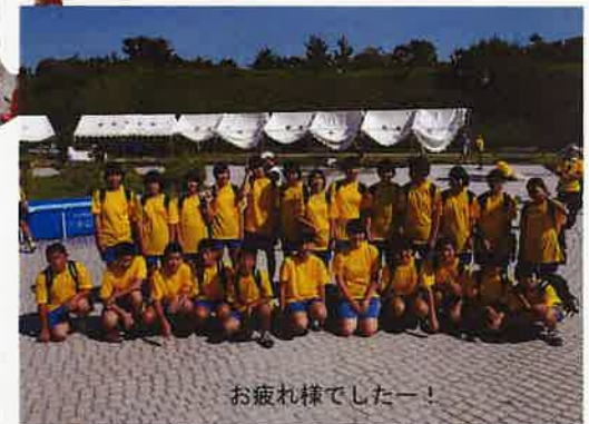
お疲れ様でしたー!