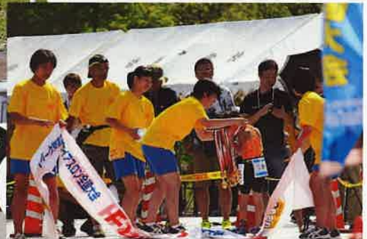
よく頑張ったねえー