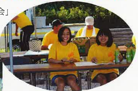
受付係は笑顔でおもてなし