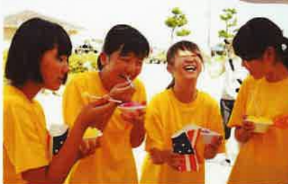
休憩時間もまた楽し!