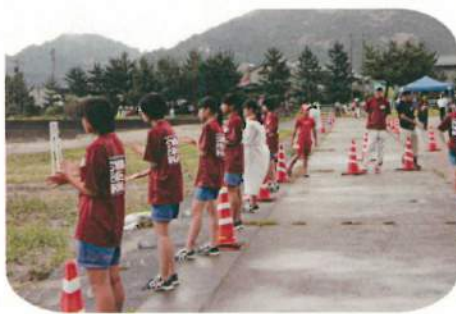
スイムの選手を応援しています