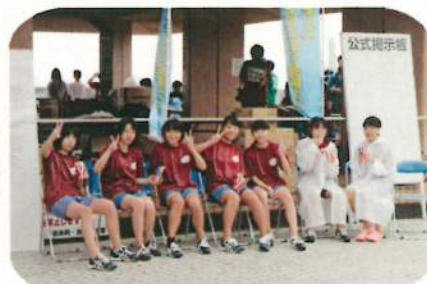
仕事の合間にハイ・ピース