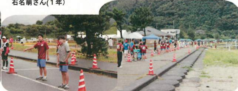
バイク(自転車)の選手を誘導中です ランの選手に水分補給のお手伝い