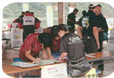
受付も丁寧な対応で